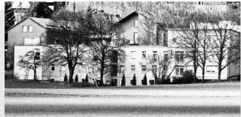
Das Haus auf der Wart (helles Gebäude vorne, Blick von Süden) gibt es seit 50 Jahren